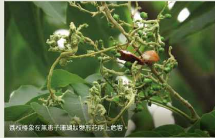
荔枝椿象在無患子珊瑚狀變形花序上危害。