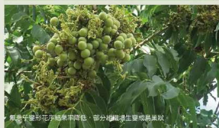
無患子變形花序結果率降低，部分組織增生變成鳥巢狀。