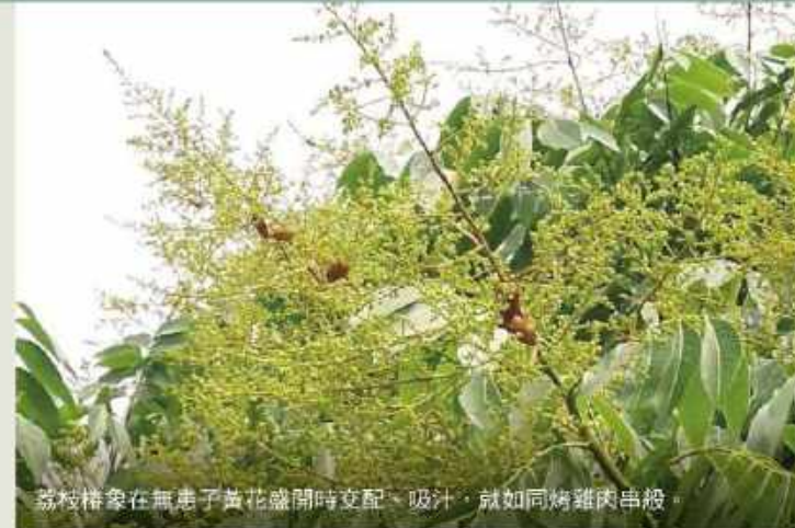
荔枝椿象在無患子黃花盛開時交配、吸汁，就如同烤雞肉串般。