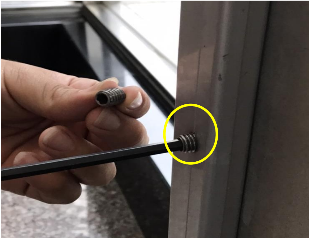
步驟五. 裝上側邊上、中、下螺絲後完成水閘門