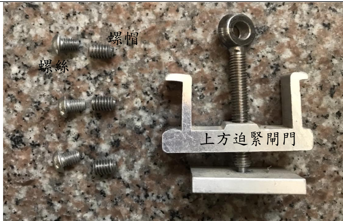
螺絲及螺帽、上方破緊閘門片