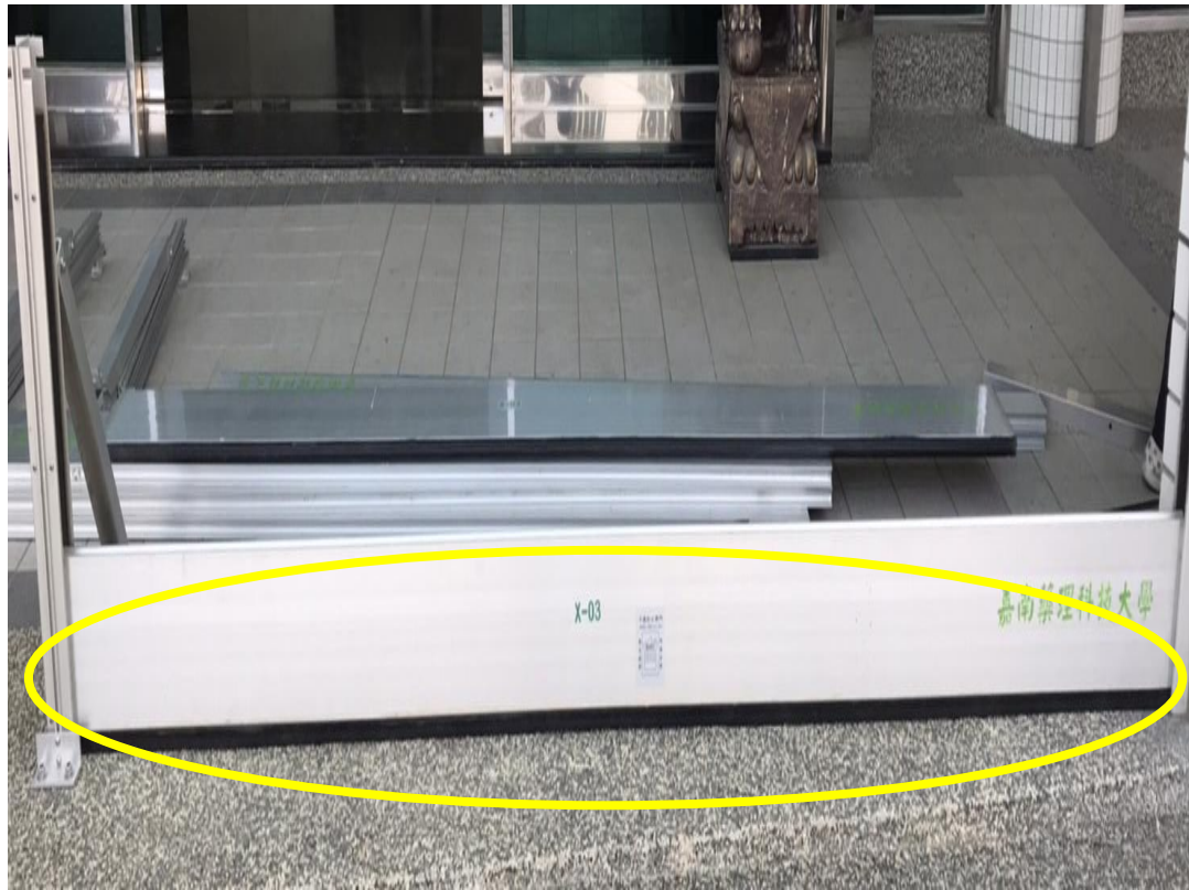
步驟六. 依序第二至最後一片閘門