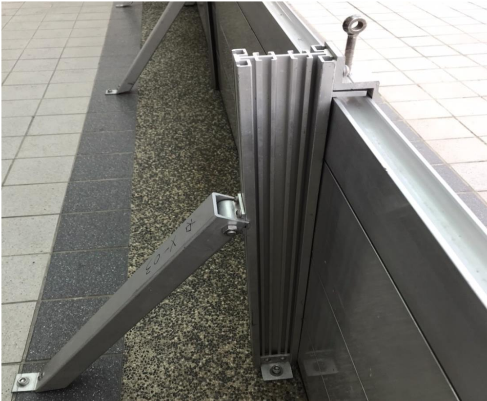
步驟八. 安裝上方迫緊閉門片(所有柱條)