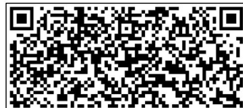
租借學/碩士服 歸還切結書