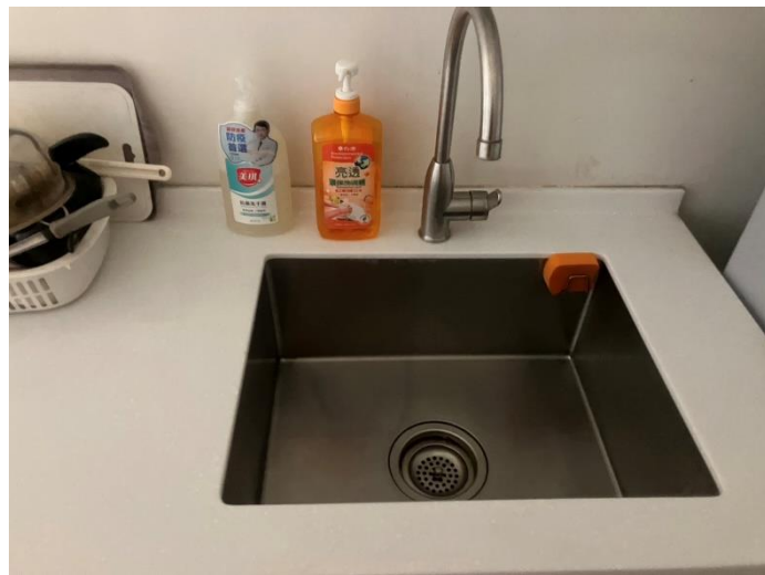
流理臺水垢已清除