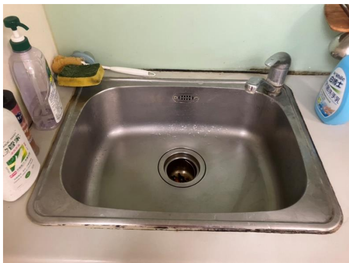
流理臺水垢已清除