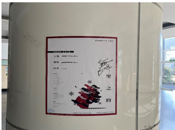
Q 棟行一樓大廳柱子