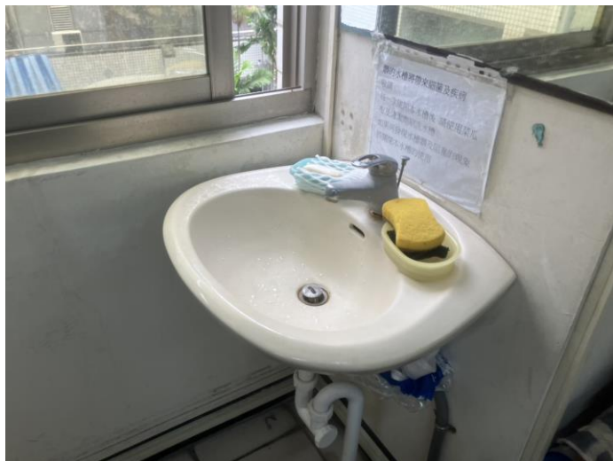
流理臺水垢已清除