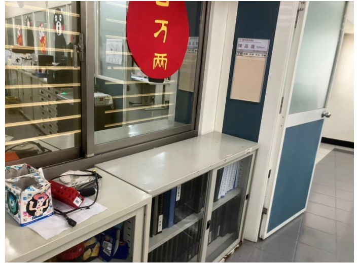
辦公室桌面灰塵已清除