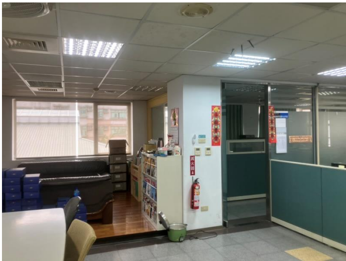
辦公室玻璃油漬已清除