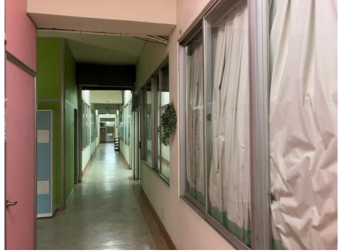
玻璃油漬與殘膠已清除