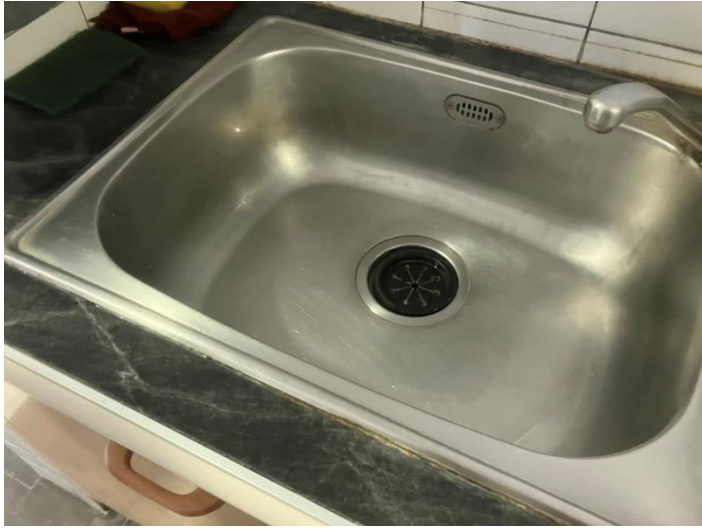
流理臺水垢已清除