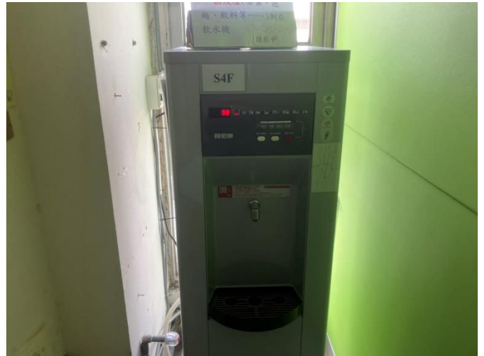
飲水機水垢茶垢已清除