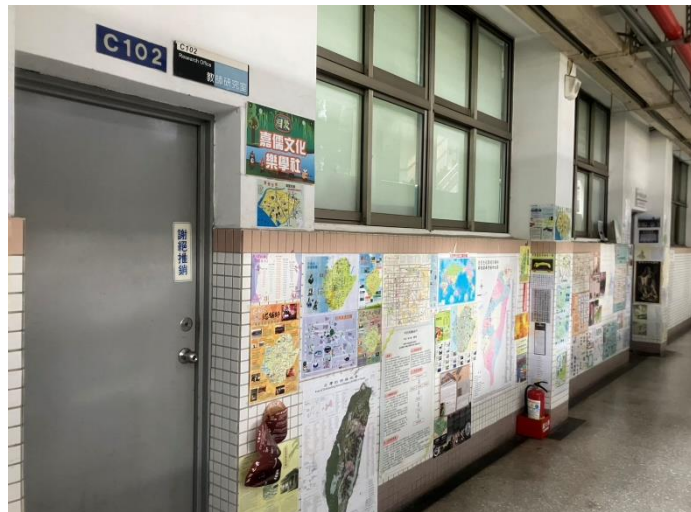
C 棟 102 教室