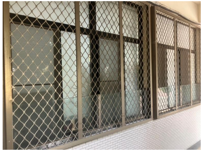
窗戶灰塵已擦拭乾淨