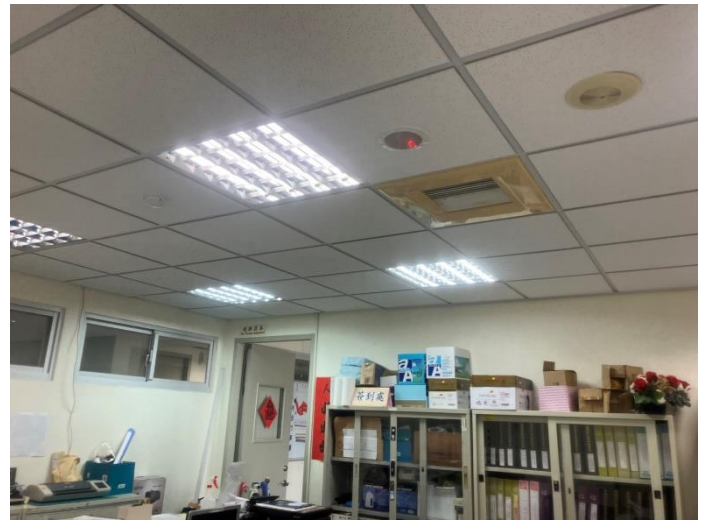
天花板蜘蛛網已清除