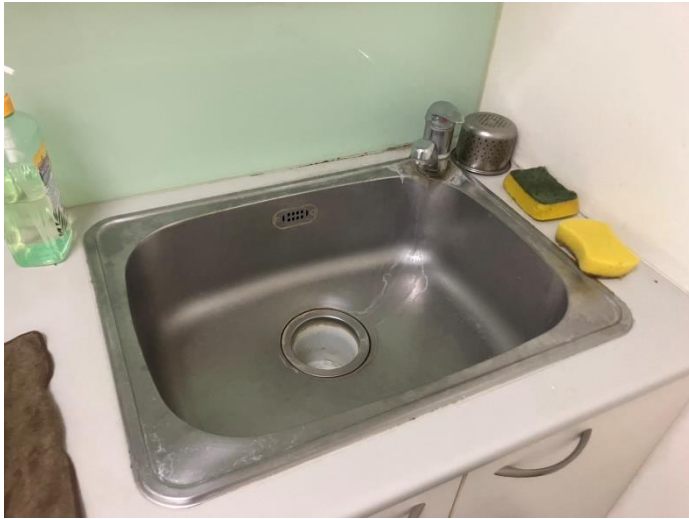
流理臺水垢已清除