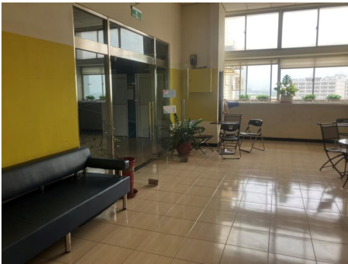
公共空間整理乾淨