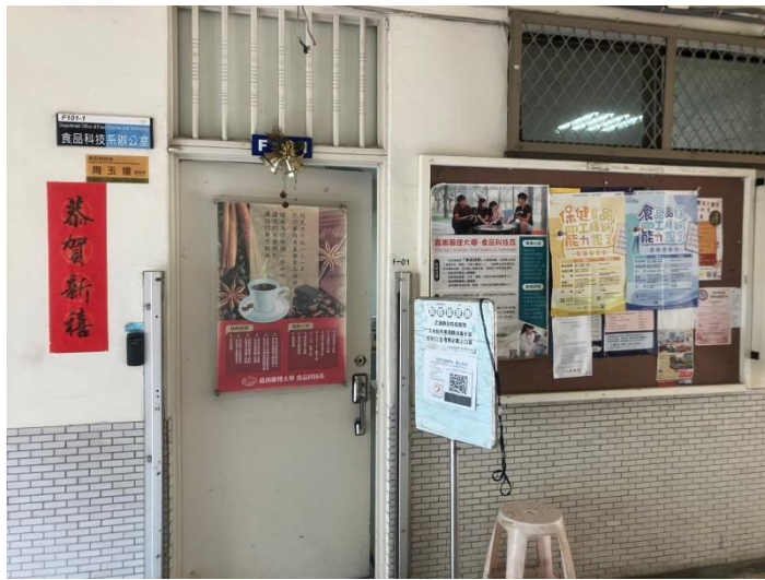
門口窗戶油漬殘膠已清除