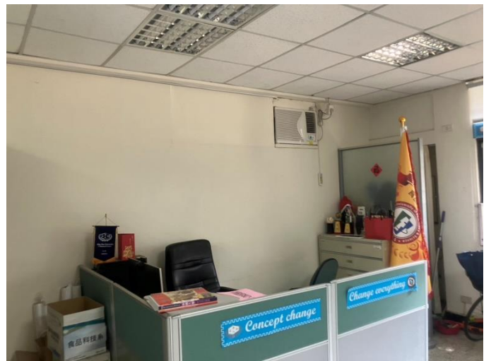
辦公室已整理乾淨