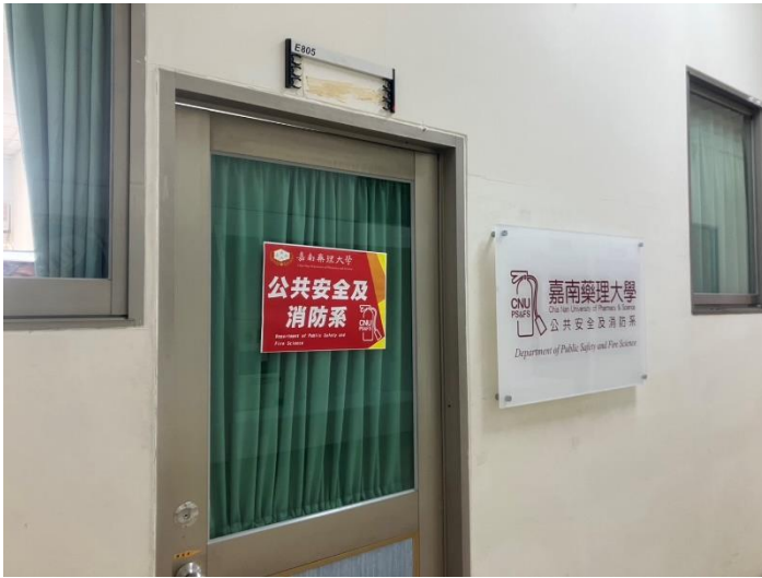
門口殘膠油漬已清除