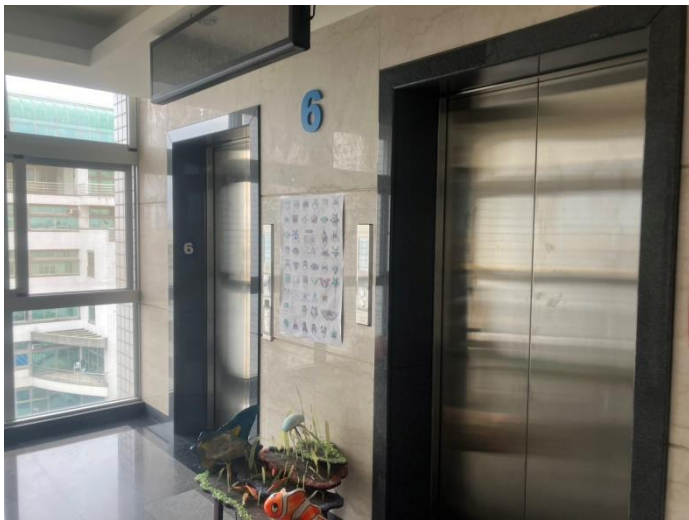
電梯牆壁殘膠已清除