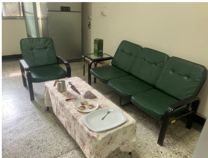
公共空間已整理乾淨